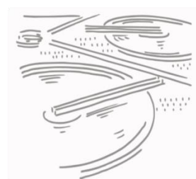
Hydraulique urbaine Eau et Assainissement